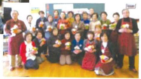
ふれあいサロンでは年に数回、お誕生日会を開いています。いくつになってもうれしいものですね。