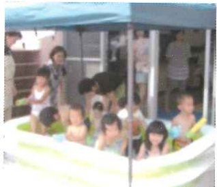
▲夏はテラスで水遊び。

地域の未就園児たちがおもちゃで遊んだり、おかあさん方がゆっくりお話ししたり、自由楽しく過ごせる場所です。