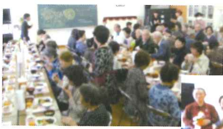
◀ふれあい懇談会では長住保育園の園児たちの歌を聴いたり、地域の方の芸能を堪能したり、たくさんおしゃべりをして、年に1回にぎやかに過ごします。

「社協」の略称で知られている社会福祉協議会。地域の人々が住み慣れたまちで、安心して生活することのできる「福祉のまちづくり」の実現を目指したさまざまな活動をおこなっています。地域住民や福祉機関、団体などにより構成された「公共性」「自主性」をもった民間福祉団体です。校区社協は小学校区単位で作られている地域住民の自主組織です。